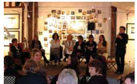
Soirée Débat - Journée internationale des droits de la femme