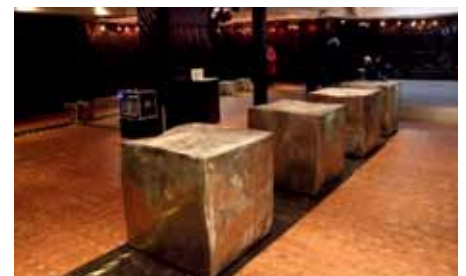
Lauréat Concours d'installation: Alain VUILLEMET